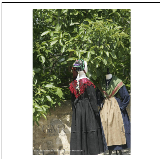
Mai 2004 - La Tour d'Aigues (FRA, 84) Costumes anciens pour l'exposition "Femmes du Midi"***May 2004 - La Tour d'Aigues (FRA, 84) - Old costumes for "women of the South" exhibition