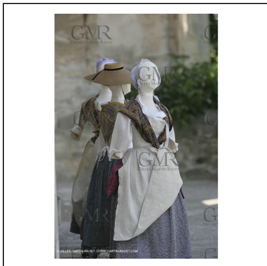
Mai 2004 - La Tour d'Aigues (FRA, 84) Costumes anciens pour l'exposition "Femmes du Midi"***May 2004 - La Tour d'Aigues (FRA, 84) - Old costumes for "women of the South" exhibition