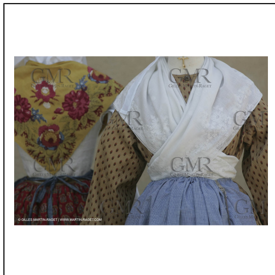
Mai 2004 - La Tour d'Aigues (FRA, 84) Costumes anciens pour l'exposition "Femmes du Midi"***May 2004 - La Tour d'Aigues (FRA, 84) - Old costumes for "women of the South" exhibition