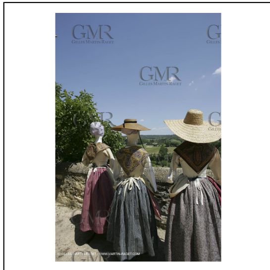
Mai 2004 - La Tour d'Aigues (FRA, 84) Costumes anciens pour l'exposition "Femmes du Midi"***May 2004 - La Tour d'Aigues (FRA, 84) - Old costumes for "women of the South" exhibition