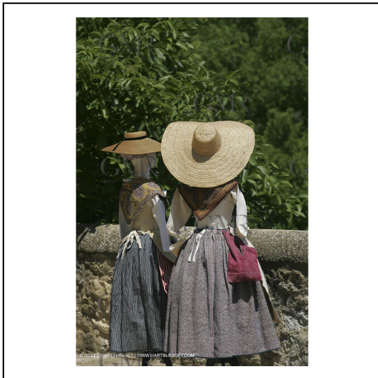
Mai 2004 - La Tour d'Aigues (FRA, 84) Costumes anciens pour l'exposition "Femmes du Midi"***May 2004 - La Tour d'Aigues (FRA, 84) - Old costumes for "women of the South" exhibition