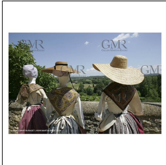
Mai 2004 - La Tour d'Aigues (FRA, 84) Costumes anciens pour l'exposition "Femmes du Midi"***May 2004 - La Tour d'Aigues (FRA, 84) - Old costumes for "women of the South" exhibition