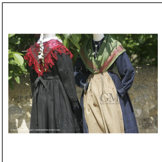
Mai 2004 - La Tour d'Aigues (FRA, 84) Costumes anciens pour l'exposition "Femmes du Midi"***May 2004 - La Tour d'Aigues (FRA, 84) - Old costumes for "women of the South" exhibition