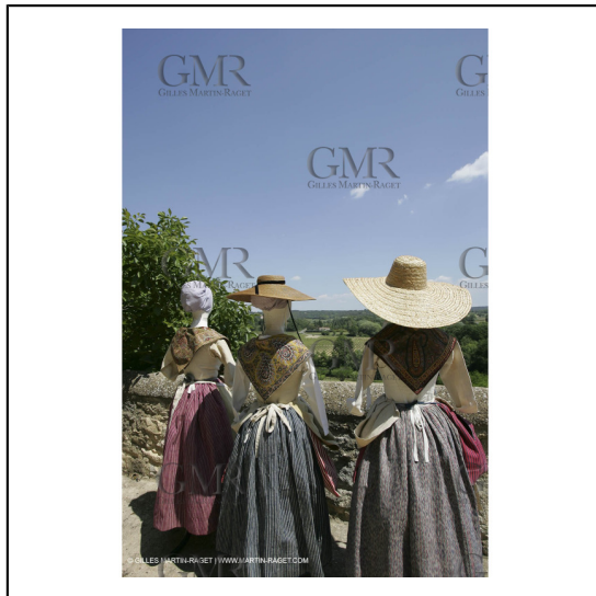
Mai 2004 - La Tour d'Aigues (FRA, 84) Costumes anciens pour l'exposition "Femmes du Midi"***May 2004 - La Tour d'Aigues (FRA, 84) - Old costumes for "women of the South" exhibition