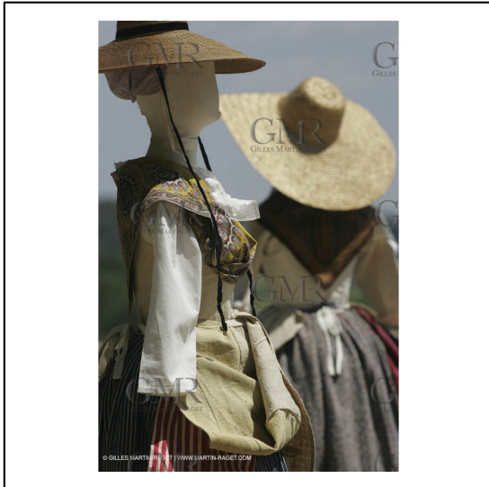
Mai 2004 - La Tour d'Aigues (FRA, 84) Costumes anciens pour l'exposition "Femmes du Midi"***May 2004 - La Tour d'Aigues (FRA, 84) - Old costumes for "women of the South" exhibition