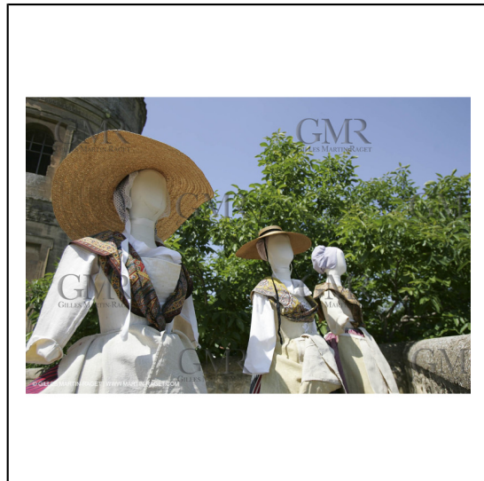
Mai 2004 - La Tour d'Aigues (FRA, 84) Costumes anciens pour l'exposition "Femmes du Midi"***May 2004 - La Tour d'Aigues (FRA, 84) - Old costumes for "women of the South" exhibition