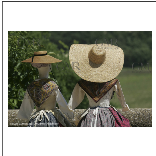
Mai 2004 - La Tour d'Aigues (FRA, 84) Costumes anciens pour l'exposition "Femmes du Midi"***May 2004 - La Tour d'Aigues (FRA, 84) - Old costumes for "women of the South" exhibition