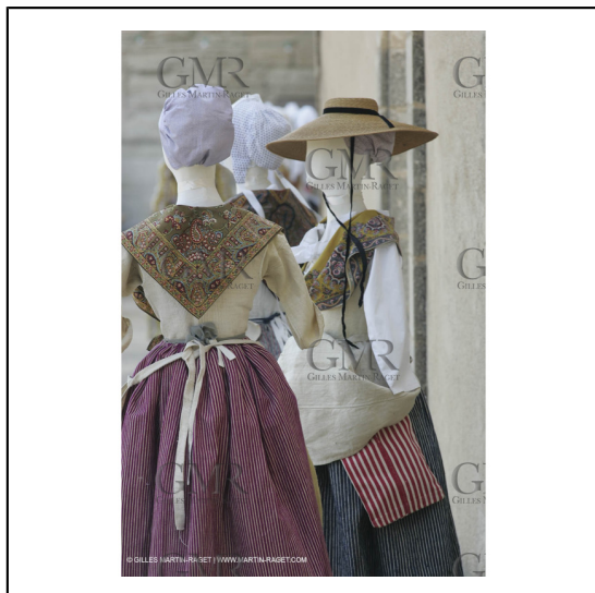
Mai 2004 - La Tour d'Aigues (FRA, 84) Costumes anciens pour l'exposition "Femmes du Midi"***May 2004 - La Tour d'Aigues (FRA, 84) - Old costumes for "women of the South" exhibition