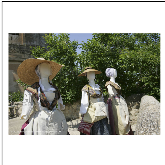
Mai 2004 - La Tour d'Aigues (FRA, 84) Costumes anciens pour l'exposition "Femmes du Midi"***May 2004 - La Tour d'Aigues (FRA, 84) - Old costumes for "women of the South" exhibition