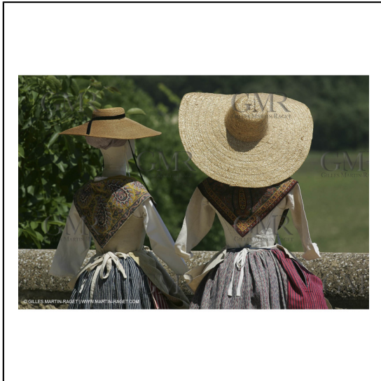
Mai 2004 - La Tour d'Aigues (FRA, 84) Costumes anciens pour l'exposition "Femmes du Midi"***May 2004 - La Tour d'Aigues (FRA, 84) - Old costumes for "women of the South" exhibition