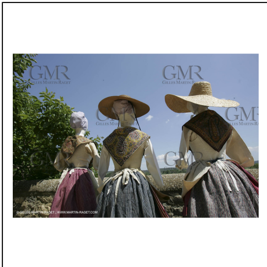
Mai 2004 - La Tour d'Aigues (FRA, 84) Costumes anciens pour l'exposition "Femmes du Midi"***May 2004 - La Tour d'Aigues (FRA, 84) - Old costumes for "women of the South" exhibition