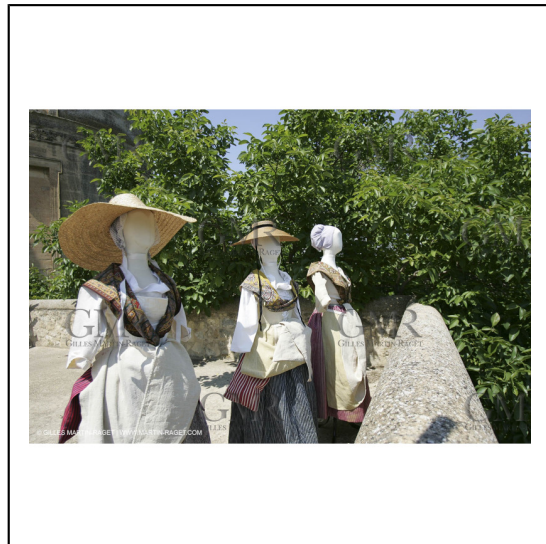
Mai 2004 - La Tour d'Aigues (FRA, 84) Costumes anciens pour l'exposition "Femmes du Midi"***May 2004 - La Tour d'Aigues (FRA, 84) - Old costumes for "women of the South" exhibition