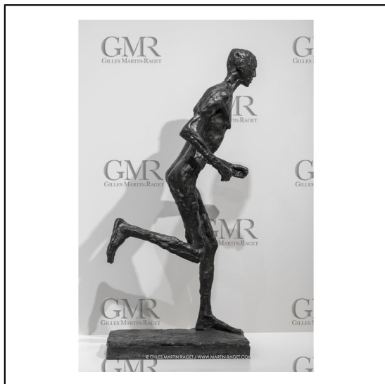
30/10/2023, Montpellier (FRA), oeuvre de Germaine Richier, Exposition Centre Pompidou - Musée Fabre 2023, Le Coureur 1955, Bronze patiné foncé, Fondateur : Susse, Paris, Hauteur totale : 205 cm, Terrasse : 13 x 54 x 94 cm, Fond national d'art contemporain, Paris, achat par commande à l'artiste en 1955