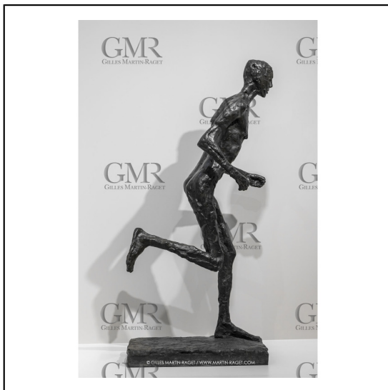
30/10/2023, Montpellier (FRA), oeuvre de Germaine Richier, Exposition Centre Pompidou - Musée Fabre 2023, Le Coureur 1955, Bronze patiné foncé, Fondateur : Susse, Paris, Hauteur totale : 205 cm, Terrasse : 13 x 54 x 94 cm, Fond national d'art contemporain, Paris, achat par commande à l'artiste en 1955